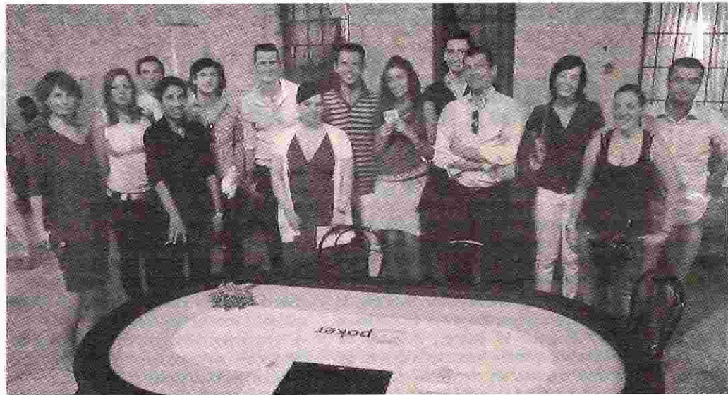
Il Gruppo giovani dell'Api davanti al tavolo al termine della partita a poker